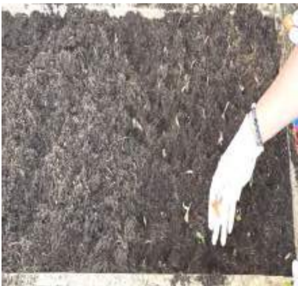
Το σχολικό προαύλιο στην αρχή της προσπάθειας – ένας άδειος καμβάς έτοιμος για δημιουργία

Η ομάδα μας επί τω έργω! Η συνεργασία και το κέφι έκαναν τον βαρύ κόπο να μοιάζει με παιχνίδι