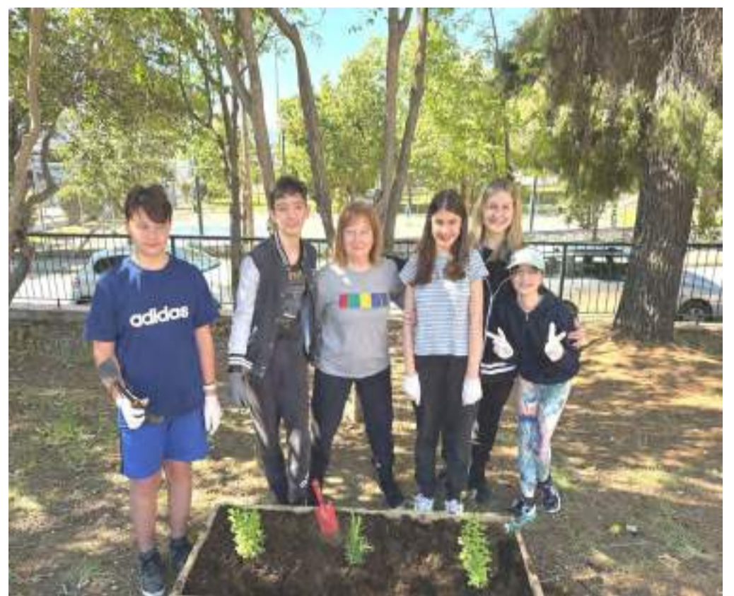
Μαθητές και καθηγητές μαζί, πριν τον ολοκληρωμένο μας κήπο. Η δύναμη της ομάδας σε μια φωτογραφία!