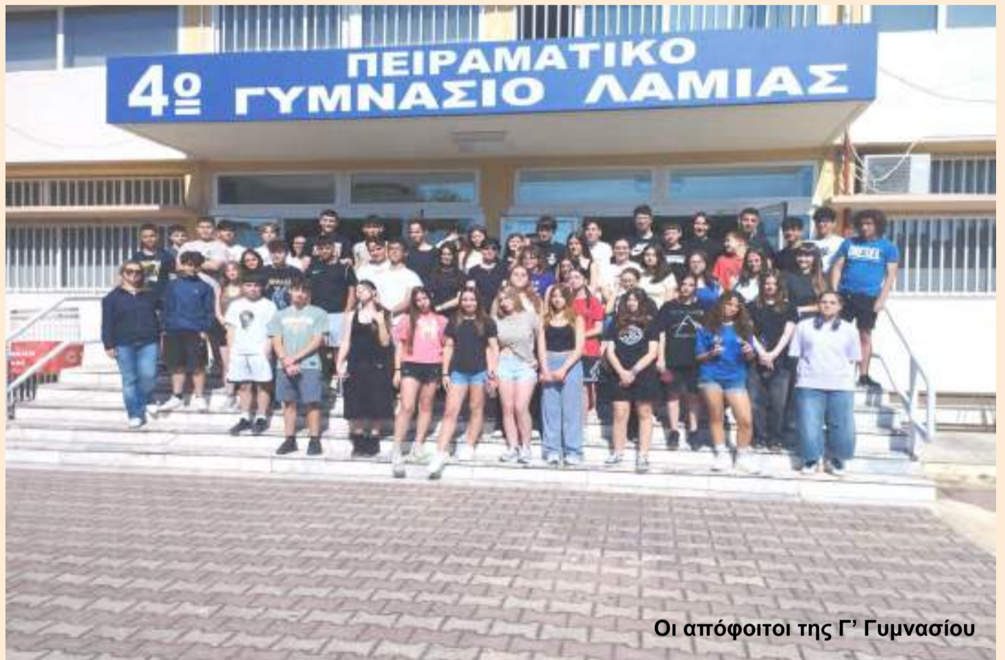
Οι απόφοιτοι της Γ' Γυμνασίου

Τα δύο αυτά χρόνια επιχειρήσαμε να δώσουμε ουσιαστικό περιεχόμενο στον θεσμό του Πειραματικού Σχολείου. Αναπτύξαμε καινοτόμες δράσεις, ενισχύσαμε τη συνεργασία με την εκπαιδευτική και την τοπική κοινότητα, επενδύσαμε στη συνεχή επαγγελματική ανάπτυξη των εκπαιδευτικών μας και δημιουργήσαμε ευκαιρίες ώστε οι μαθητές και οι μαθήτριές μας να ανα-